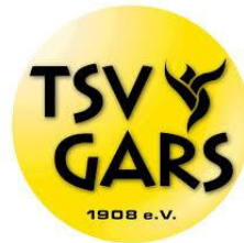
TSV Gars am Inn 1908 e.V.