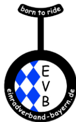
Einradverband Bayern e.V.

Wir wünschen allen Teilnehmern viel Erfolg und Freude beim Schwimmen, Einradfahren und Laufen